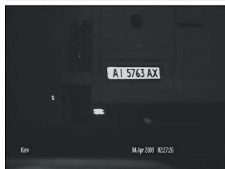
Тестирование в ночных условиях

Мы благодарим все компании, предоставившие камеры для тестирования. Надеемся и в дальнейшем проводить подобные сравнительные тесты, чтобы предоставить нашим клиентам и партнерам информацию о тех моделях телекамер, которые оптимально подходят для работы с системами автоматического распознавания автомобильных номеров.