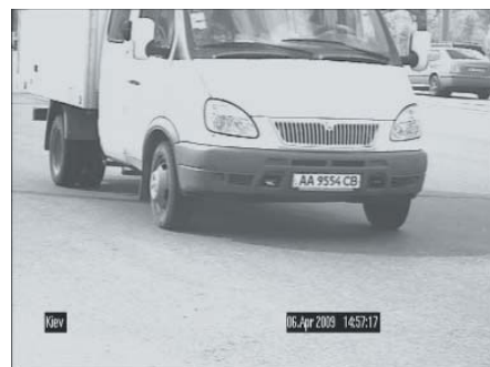
Тестирование в дневных условиях

Телекамера на тестирование представлена компанией Bosch.