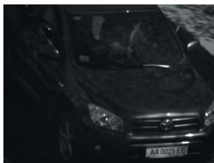
Тестирование в дневных условиях

Телекамера на тестирование TKH-259 предоставлена компанией «СпецТелеТехника».