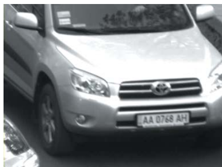
Тестирование в дневных условиях

Телекамера Infinity QX-580SD подходит для наблюдения за парковками, где можно обеспечить полную остановку машины перед шлагбаумом или снижение скорости при въезде в зону распознавания (например, наличие поворота, или препятствия «лежачий полицейский»).