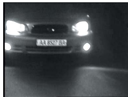
Тестирование в ночных условиях (высокая скорость)