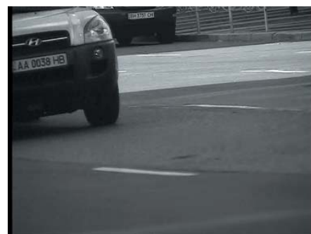
Тестирование в дневных условиях