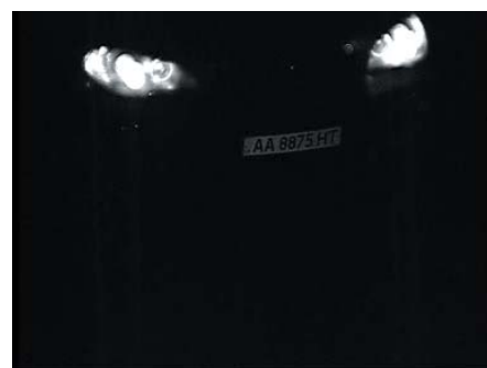
Тестирование в ночных условиях