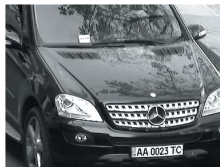
Тестирование в дневных условиях

При скорости до 80 км/ч Infinity CX-TWDN560SD показала хорошие результаты и днем, и ночью. Телекамера подходит для наблюдения за дорожным движением и распознавания автомобильных номеров на объектах, где скорость движения транспорта предполагается не выше 80 км/ч.