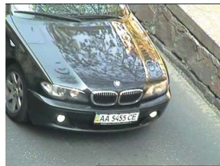
Тестирование в дневных условиях

Данную модель можно использовать для наблюдения и распознавания автомобильных номеров на парковках и других объектах с полной остановкой машины перед шлагбаумом или со снижением скорости при въезде