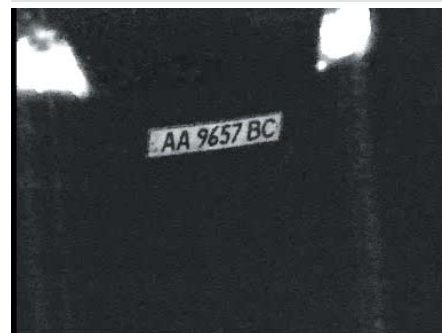
Тестирование в ночных условиях