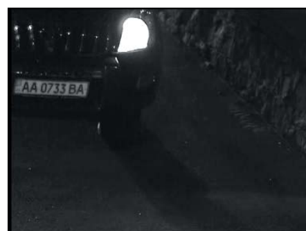
Тестирование в ночных условиях (низкая скорость)