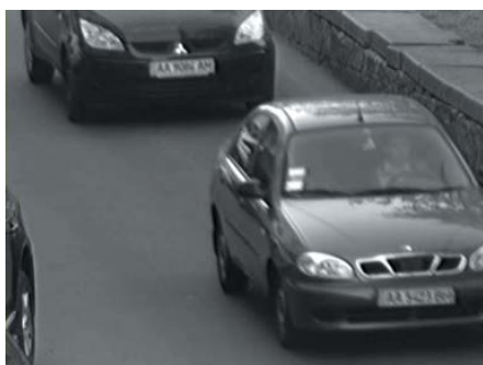
Тестирование в дневных условиях