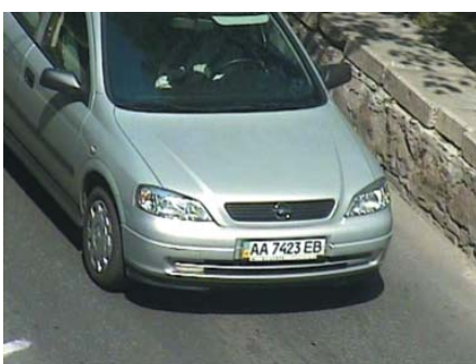
Тестирование в дневных условиях

В целом, можно сказать, что телекамера Acumen Ai-CC93 показала хорошие результаты днем, но ночью изображение было сма-