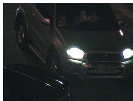
Тестирование в ночных условиях

ме того, при использовании данного режима появляется нежелательный шум.