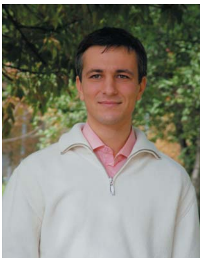
Автор: Юрий Бухтияров, директор ООО «Видео Интернет Технологии»

Для этого номера журнала наши партнеры из украинской компании «Видео Интернет Технологии» подготовили материал, который наверняка окажется полезен всем тем, кто интересуется проблематикой автоматического распознавания автомобильных номеров. В этом номере мы публикуем результаты практических испытаний десяти телекамер с аналоговым видеовыходом, которые были протестированы на возможность работы с системами автоматического распознавания автомобильных номеров. Телекамеры испытывались в дневных и ночных условиях на разных скоростных режимах. Эту статью мы публикуем в рубрике «авторские страницы» только потому, что наши специалисты не принимали непосредственного участия в тестировании. Тем не менее, результаты испытаний заслуживают доверия, так как они были проведены специалистами с большим опытом в этой области. Компания «Видео Интернет Технологии» давно и успешно занимается этими вопросами (на рынке систем видеонаблюдения присутствует с 2000 года). Наши читатели уже имели возможность ознакомиться с результатами тестирования модуля распознавания автомобильных номеров, разработанного компанией «Видео Интернет Технологии».