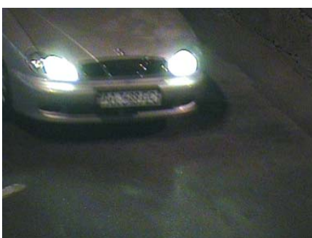
Тестирование в ночных условиях

занным. При скорости движения автомобиля до 40 км/ч, символы на номерном знаке видны четко, но при увеличении скорости номера смазываются. Эта телекамера обладает слабой чувствительностью к ИК-подсветке.