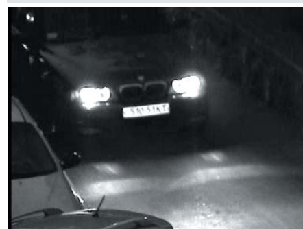
ИК-подсветка засвечивает некоторые номера

Данная модель тестировалась с объективом Tamron 13VM20100AS. Телекамера предоставлена на тестирование компанией «СТА-Электроникс».