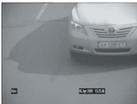
Тестирование в дневных условиях

При скорости до 150 км/ч телекамера показала прекрасные результаты. Изображения номеров видны четко. Bosch LTC-0385 прекрасно работает с внешней ИК-подсветкой. Возможности телекамеры позволяют применять ее для работы в условиях скоростных автомагистралей.