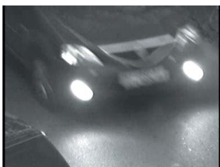
Тестирование в ночных условиях