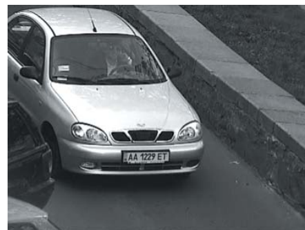
Тестирование в дневных условиях