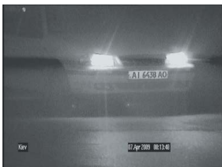
Тестирование в ночных условиях

Данная модель тестировалась с объективом Infinity SCV550GIR. Телекамера на тестирование представлена компанией Bosch.